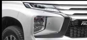
ĐÈN XE HIỆN ĐẠI Cụm đèn LED thiết kế mới, tích hợp công nghệ và trang bị hiện đại với đèn chiếu góc hỗ trợ chiếu sáng tốt hơn khi xe vào cua, giúp điều khiển xe dễ dàng và an toàn hơn.