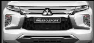
THIẾT KẾ LƯỚI TẢN NHIỆT MỚI VIÊN MÀ BẠC Tăng thêm vẻ lịch lãm và mạnh mẽ.