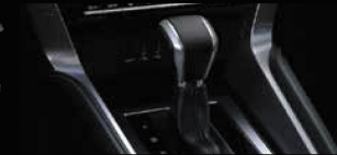
HỘP SỐ TỰ ĐỘNG 8 CẤP VỚI CHẾ ĐỘ THỂ THAO SPORT MODE Chế độ thể thao giúp tăng số linh hoạt.