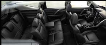
KHÔNG GIAN 7 CHỖ RỘNG RÃI VỚI NỘI THẤT ĐẠC CAO CẤP GHÉ LẠI VÀ GHẾ HÀNH KHÁCH PHÍA TRƯỚC CHÍNH ĐIỆN 8 HƯỚNG TIỆN NGHI*