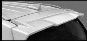
CÁNH LƯỚI GIÓ THỂ THAO VÀ ẮNG-TEN VÂY CẢ Trang bị tiêu chuẩn, mang đến sự cá tính và hiện đại.