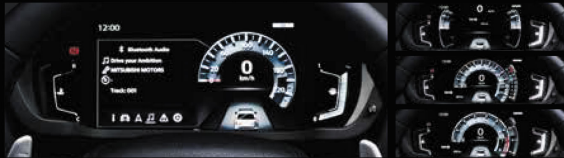
ĐỒNG HỒ KỸ THUẬT SỐ HIỆN ĐẠI Cụm đồng hồ kỹ thuật số với màn hình LCD kích thước lớn 8-inch hiện đại giúp người lái dễ quan sát các thông tin hiển thị cũng như cho phép khả năng tùy chỉnh các dạng hiển thị khác nhau tùy theo nhu cầu và sở thích của người dùng.