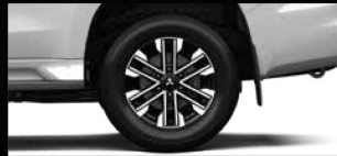
MÀM BÁNH XE HỢP KIM 18 INCH HAI TÔNG MÀU Thiết kế mới nổi bật hơn, mạnh mẽ hơn.