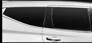
KÍNH CỬA TỐI MÀU* Kính cửa sau và kính phía sau tối màu tăng thêm vẻ sang trọng.