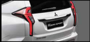
ĐÈN HẬU DẠNG LED THIẾT KẾ MỚI Hiện đại và tối ưu cho khả năng nhận biết từ phía sau.