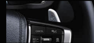
LẤY CHUYỂN SỐ TRÊN VỎ LĂNG